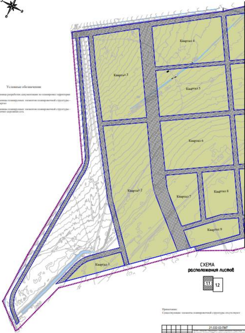
СХЕМА расположения листов